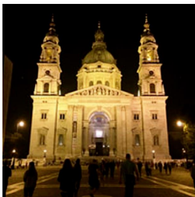
厳かな雰囲気漂う「聖イシュトヴァーン大聖堂」。

首都ブダペストでは、世界遺産にも登録されている美しい街並みや歴史ある建物が楽しめます。