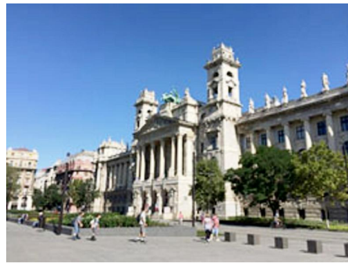
あと一歩のところまで国会議事堂の建築デザイン選考から漏れた「民族博物館」。

見る場所、角度、遠近、明暗によって、同じ建築物や場所でも全く違った表情が楽しめます。