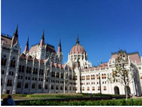
晴天に映える素晴らしい造りの「国会議事堂」。