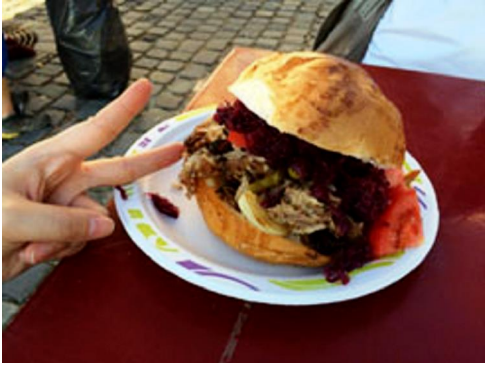
ハンガリー名産のマンガリツァ豚を使ったハンバーガー。