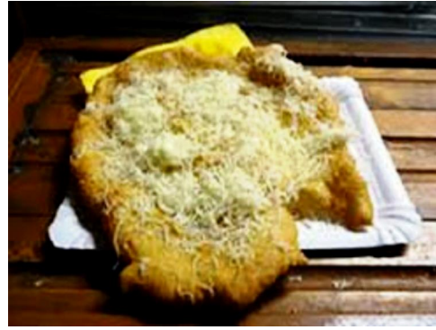
クリームチーズとチーズがのった、ハンガリー風揚げパン「ランゴージュ」。

などなど、こちらではご紹介しきれませんが、日本とは全く異なった「食の豊かさ」を目で、舌で堪能することができます。