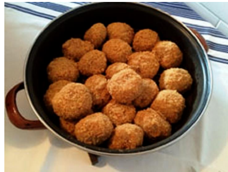
プラムをマッシュポテトで包んで揚げた「シルバーシュ・ゴンボーツ」。粉砂糖をまぶして頂きます。