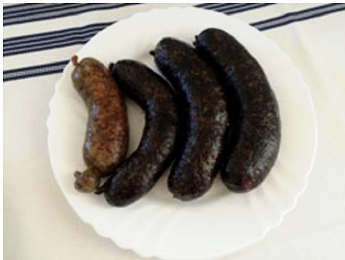
彼の実家で育てている豚を使ったブラッドソーセージ「ヴェーレシュ・フルカ」。