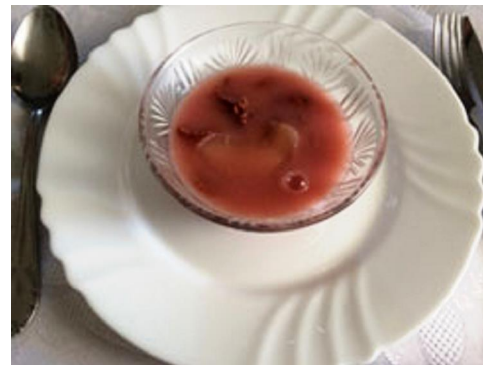
スミザクラの甘い冷製スープ「ヒデグ・メツジュレヴェシュ」。