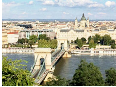
王宮の丘から望む「くさり橋」。