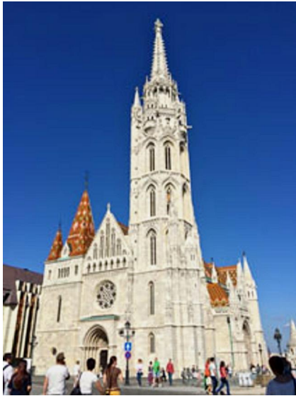
屋根の色合いがとても印象的な「マーチャーシュ教会」。