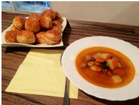
ハンガリーを代表する料理、パプリカパウダーが決め手の「グヤーシュレヴェシュ」。