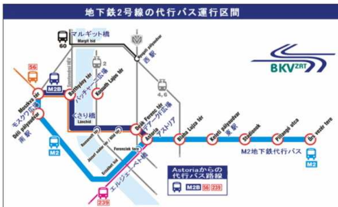
地下鉄2号線代行バス運行区間（6月9日（金）から11日（日））