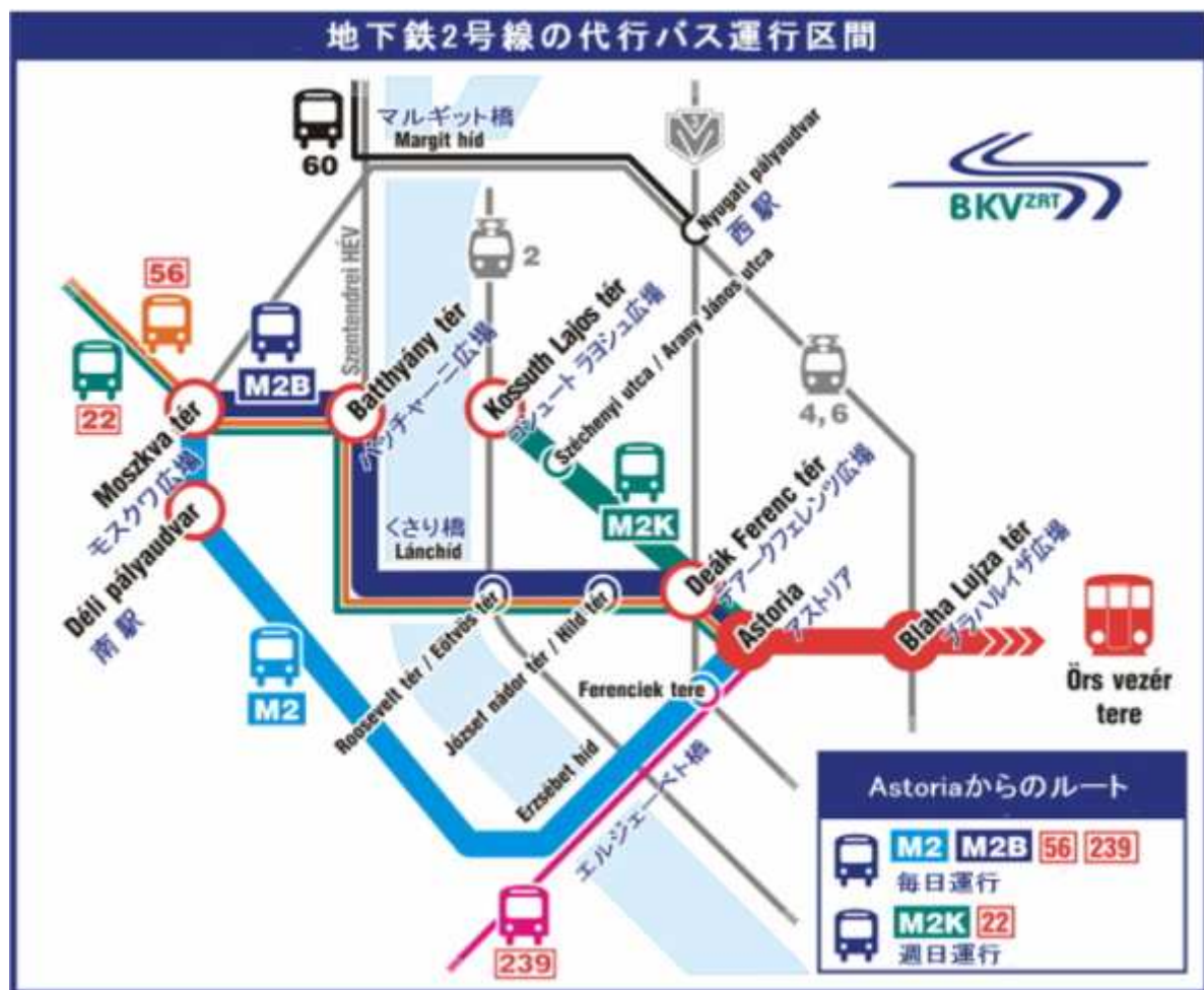
地下鉄2号線代行バス運行区間（6月12日（月）から8月19日（土））