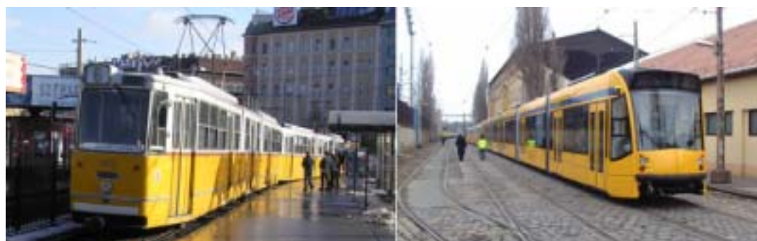
市電4・6系統の新旧電車