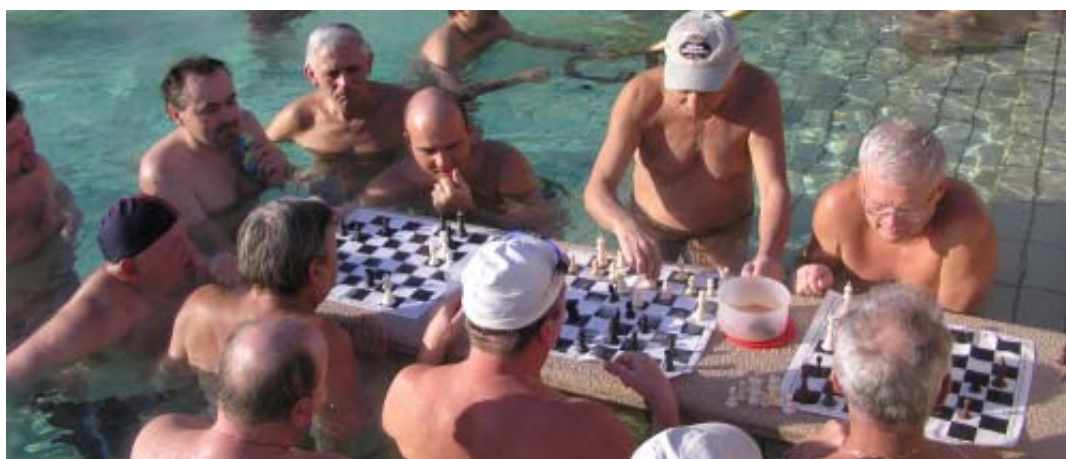
名物セーチャーニ温泉のチェス対決 湯温が低いので長時間の対局も可能です。

注:上のそれぞれの表では、便宜上、遊泳や水浴目的で入る施設を「プール」、日本風に湯につかる目的で入る施設を「温泉」と記してあります。温泉の泉質の多くはフッ化物を多く含む炭酸水素塩や硫酸塩温泉。