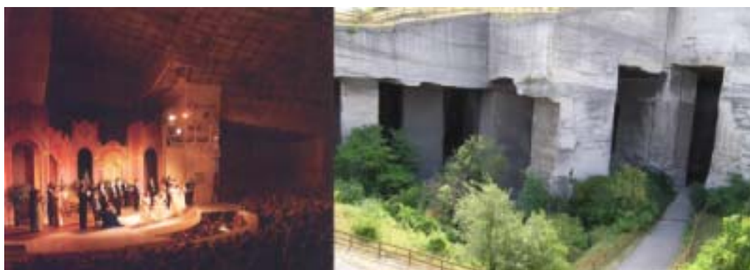
フェルトゥー・ラーコシュ石切場とコンサートホール