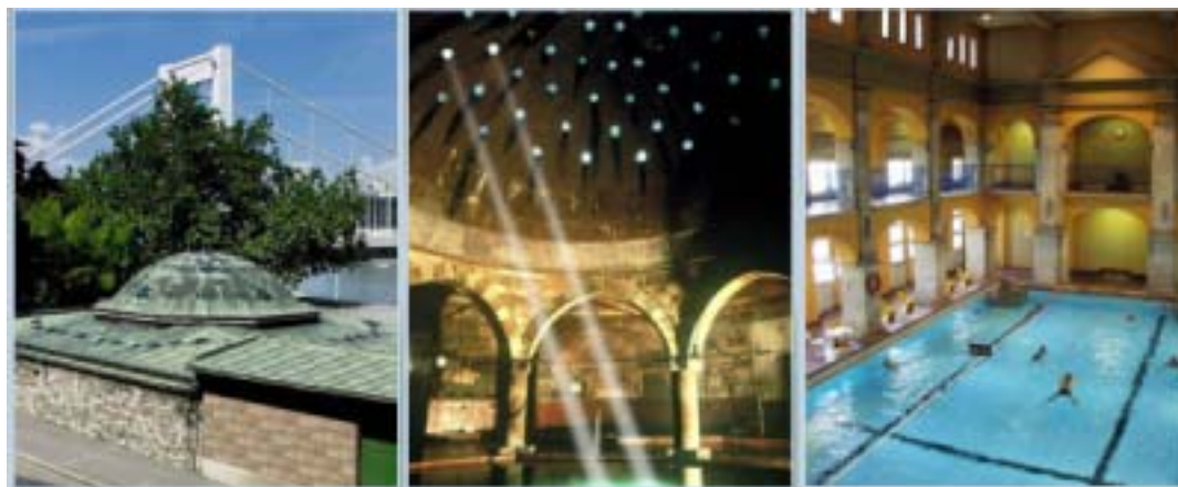
エルジェーベト橋のたもとに建つルダシュ温泉トルコ風の浴槽とプール

16世紀にオスマントルコによって建設された八角形の浴槽はトルコ式のドームに覆われ、往時の面影を色濃く残しています。