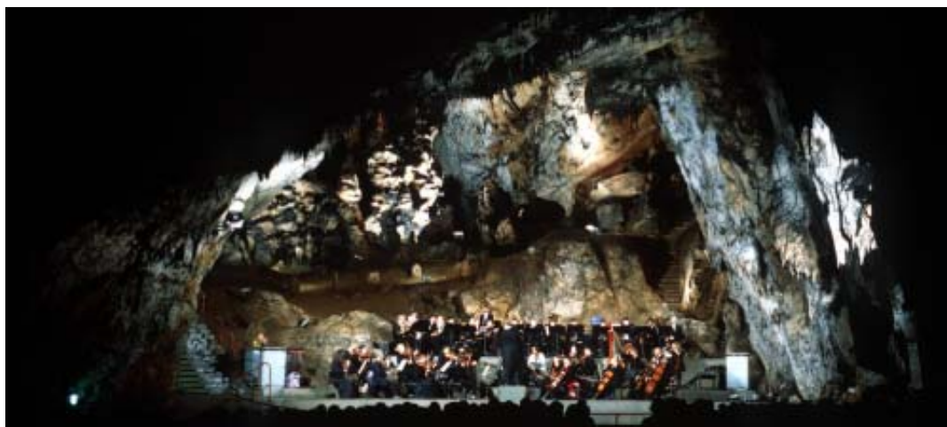
世界遺産アグテレク鍾乳洞のコンサートホール