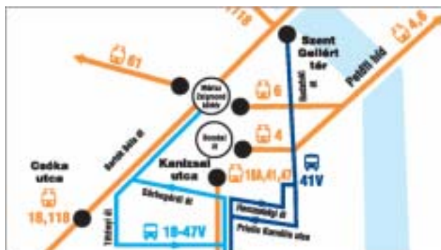
トラム 18、118、41、47 系統は oricz Zsigmond korter と Bocskai ut の間で運休