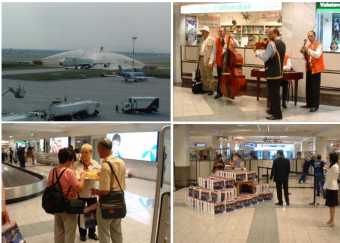
JAL チャーター初便の歓迎

ブダペスト空港は、7月28日にセントレアから到着したJALジャンボジェットを水のアーチで歓迎し、政府観光局は入国審査の済まれたお客様をロマ(ジプシー)楽団の演奏とウェルカムドリンクで歓迎するとともに観光資料をプレゼントしました。