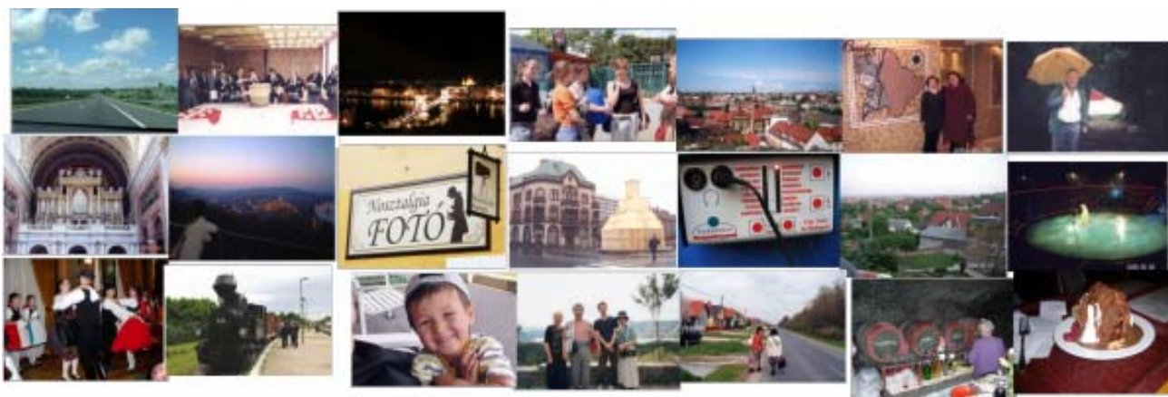
作品と共に寄せられた思い出の写真

作品はHPでご覧ください。 http://www.hungarytabi.jp/index2.htm