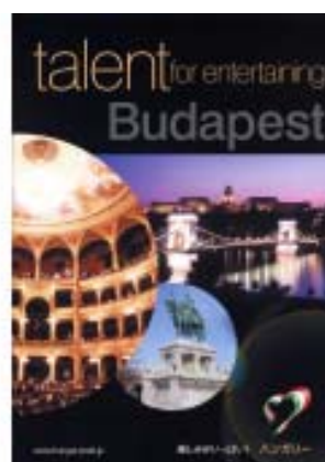
左がこの度完成した日本語版 Hungary (16 ページ)、右は Budapest (8 ページ)