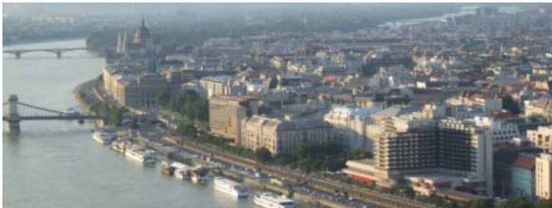
世界遺産地域内、ドナウに面して建つブダペスト・マリオット・ホテル(右端)

ブダペスト・マリオット・ホテルは2007年末までの予定で改修工事に着手します。主な改良点は、バルコニーを室内に取り込み客室面積を拡大すること、会議室面積を拡大すること、ファンクションルームを5室から11室に増加すること、レストランに新たなデザインを取り入れることなどです。改良工事中も通常通りの営業が続けられます。