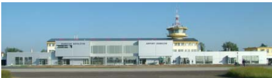
完成したデブレツェン空港ターミナル

今年中に新コントロールが建設され、滑走路も延長される計画です。なお、現在ブダペスト・デブレツェン間に国内線が就航している他、欧州内の定期便が就航しています。