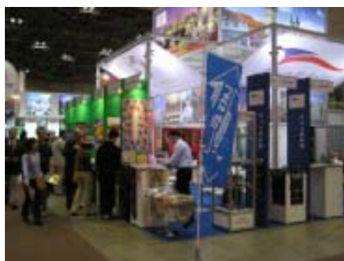
ハンガリーブース