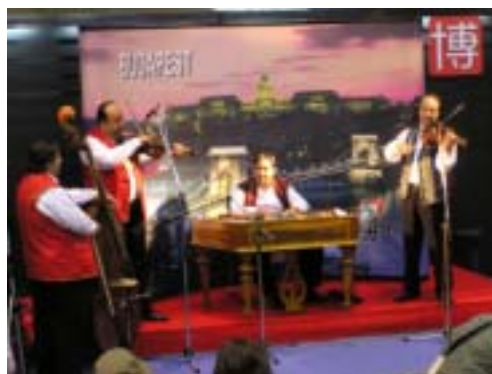
ステージで演奏するハンガリーの楽団