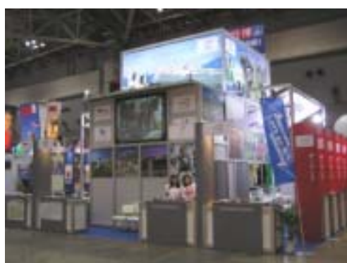
ヨーロッパカルテットV4ブース