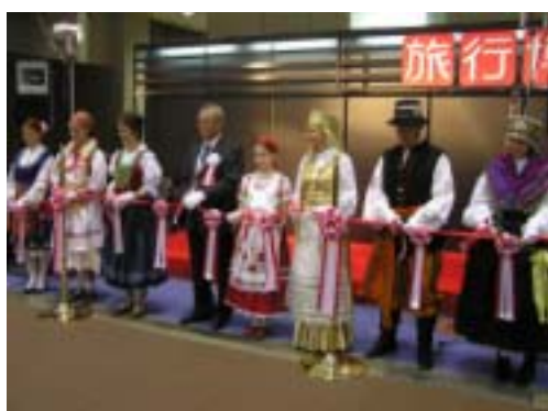
民族衣装による中欧ゾーン開会式(中央がハンガリー)

中欧ゾーンに設けられたステージでは、民族衣装を身にまとった女性たちによる開会式や民族衣装のファッションショー、ハンガリー・ジプシー楽団による演奏が行われ、たくさんのお客様にご覧いただきました。また、V4セミナー・ワークショップにもたくさんのお客様の旅行会社の皆さんに参加いただき、活発な商談を行っていただきました。