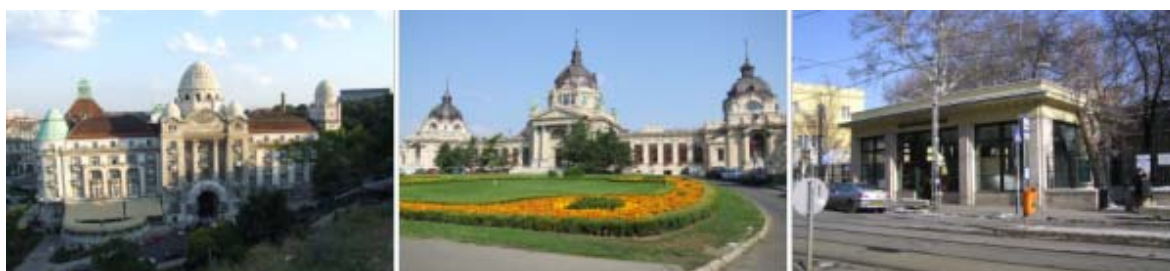
左から順に、ゲッレールト温泉、セーチャーニ温泉、ルカーチ温泉

ゲッレールトでは男女別の浴室と更衣室など、セーチャーニは温水プールと更衣室など、ルカーチは温水プールと付属施設並びにファサードなどがそれぞれ改修される予定です。