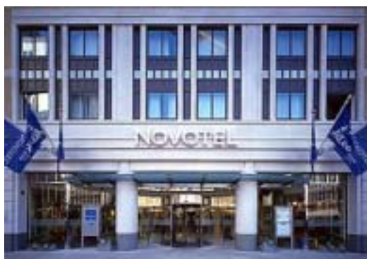
ノボテル ブダペスト ダニューブ

H-1027 Budapest, Bem rakpart 33-34. Tel: (36-1)458-4900 Fax: (36-1)458-4909