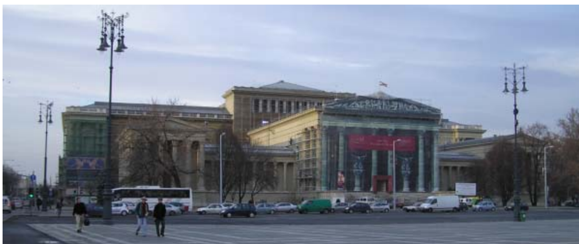
ブダペスト国立西洋美術館