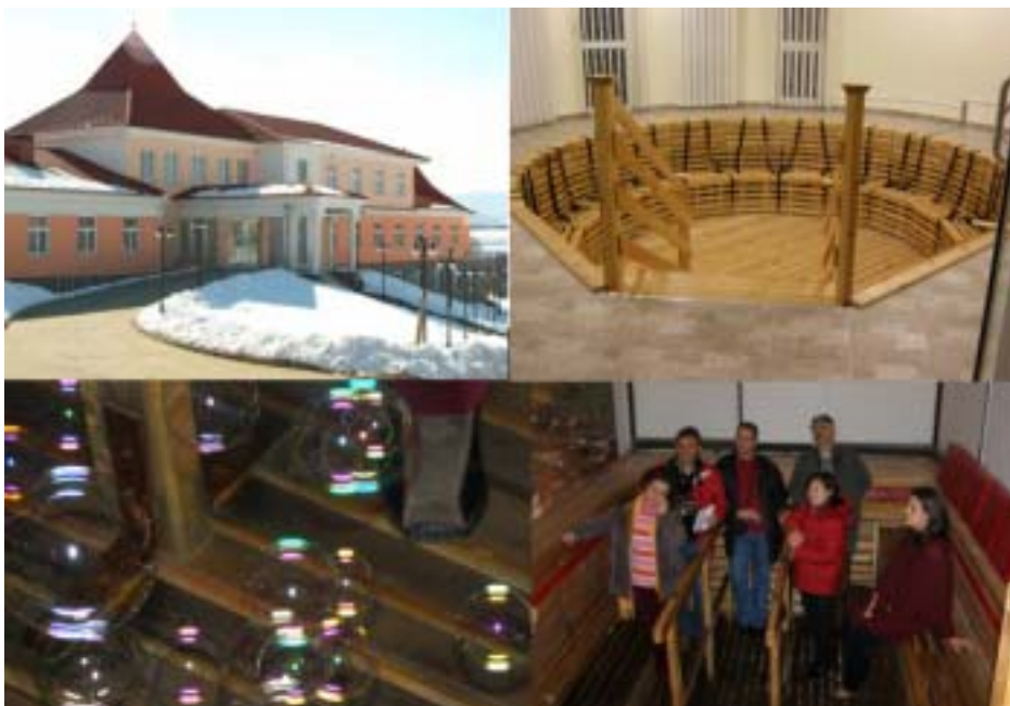
左上から時計回りに、新たに建設された「Mofetta 施設」、施設内の炭酸ガス風呂、入浴風景(風呂の周囲に示された赤い線まで炭酸ガスで満たされている)、風呂の中のシャボン玉(炭酸ガスは空気より重たいので、空気中で飛ばしたシャボン玉は、炭酸ガスの中では浮いている)