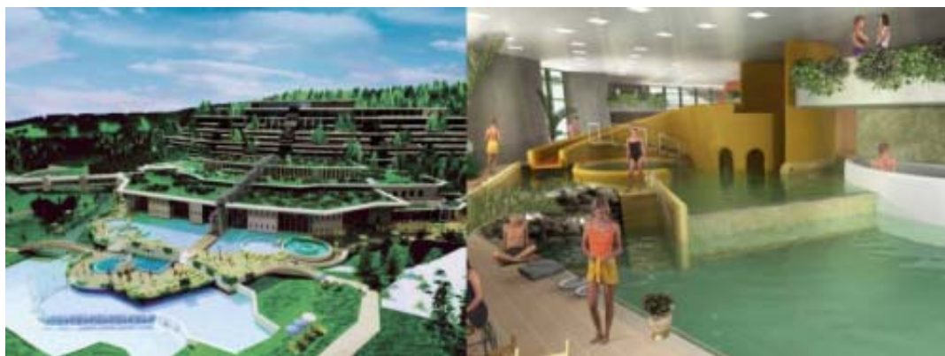
エゲルサローク・温泉・ウェルネス完成予想図(HP より転載)