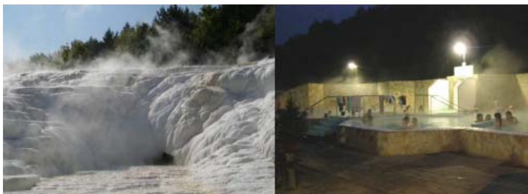
エゲルサローク温泉の石灰華と露天風呂

この複合施設は、1,900m 2 の敷地に、ホテルを併設し、露天風呂、泡風呂、ウォータースライダー、子供プールなど 16 種類の温泉やプールを設け、年齢を問わず楽しめる施設となります。