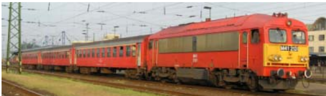
ハンガリー国鉄ローカル列車