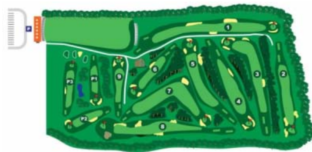
ハイランド・ゴルフ場コースイメージ(HPより)

2007年5月、ブダペスト22区に9ホールのゴルフコースと、40打席の練習場を持つブダペスト ハイランド ゴルフ場が開業しました。 http://www.highlandgolf.hu/