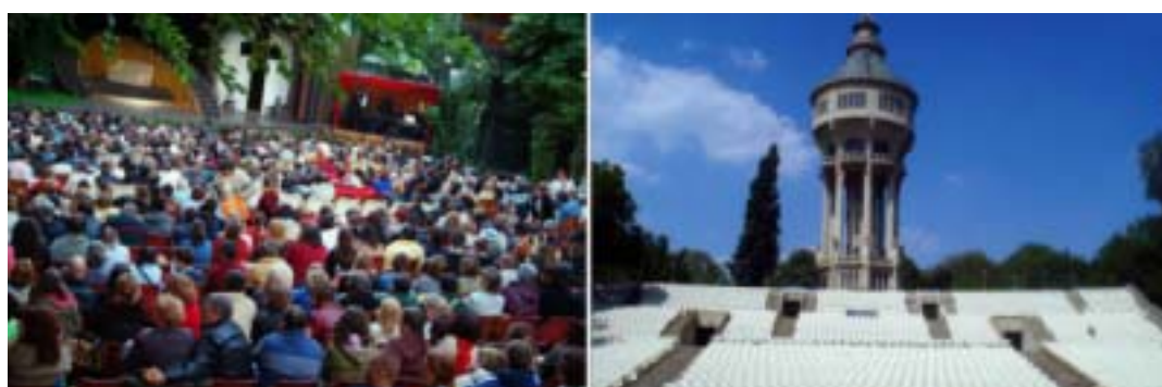
左: ヴァーロシュマヨル野外劇場、右: マルギット島野外劇場(HPより)