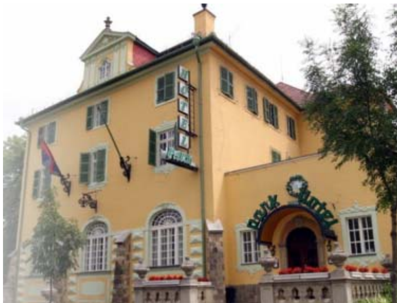
エゲル ホテルパーク イメージ

6月13日に Hotel Eger & Park の Hotel Park 部分のリノベーション工事が終了し、装いも新たに4つ星ホテルとして開業しました。エアコンを備えた 37 の客室をもつこのホテルは、3つ星 Hotel Eger (客室 209 室) に隣接し、エゲル大聖堂から約 300m、エゲル駅から約 1km に位置しています。 http://www.hotelegerpark.hu/