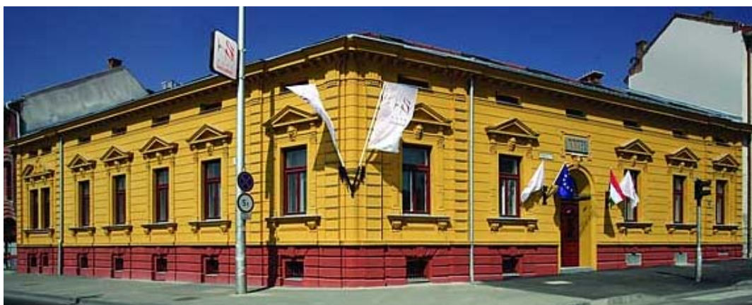
ブティック・ホテル・ソピャネの外観 (HPより転載)

このホテルは、22室からなり、モダンな室内と歴史的な外観の双方の矛盾をテーマにしたデザインを取り入れた設計となっています。 http://www.hotelsopiana.hu