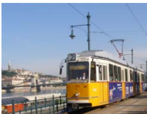
トラム2号線の運転区間案内図

マルギット橋のたもとからドナウ沿いにペスト側を南下するこのトラムは、国会議事堂、くさり橋、ヴィガドー劇場、エルジェーベト橋、中央市場を訪れるのに便利であるとともに、車窓からは対岸の王宮の丘やゲッレルトの丘などの景観を楽しむことの出来る路線として人気があります。