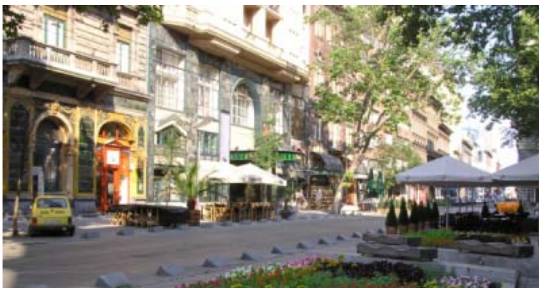
ブダペスト Thalia 劇場

また、このサイトでは、国立コンサートホール、Budafest 夏の音楽祭、国立西洋美術館などのチケットも購入可能です。 http://www.jegymester.hu/index.jsp?lang=ENG (英語)