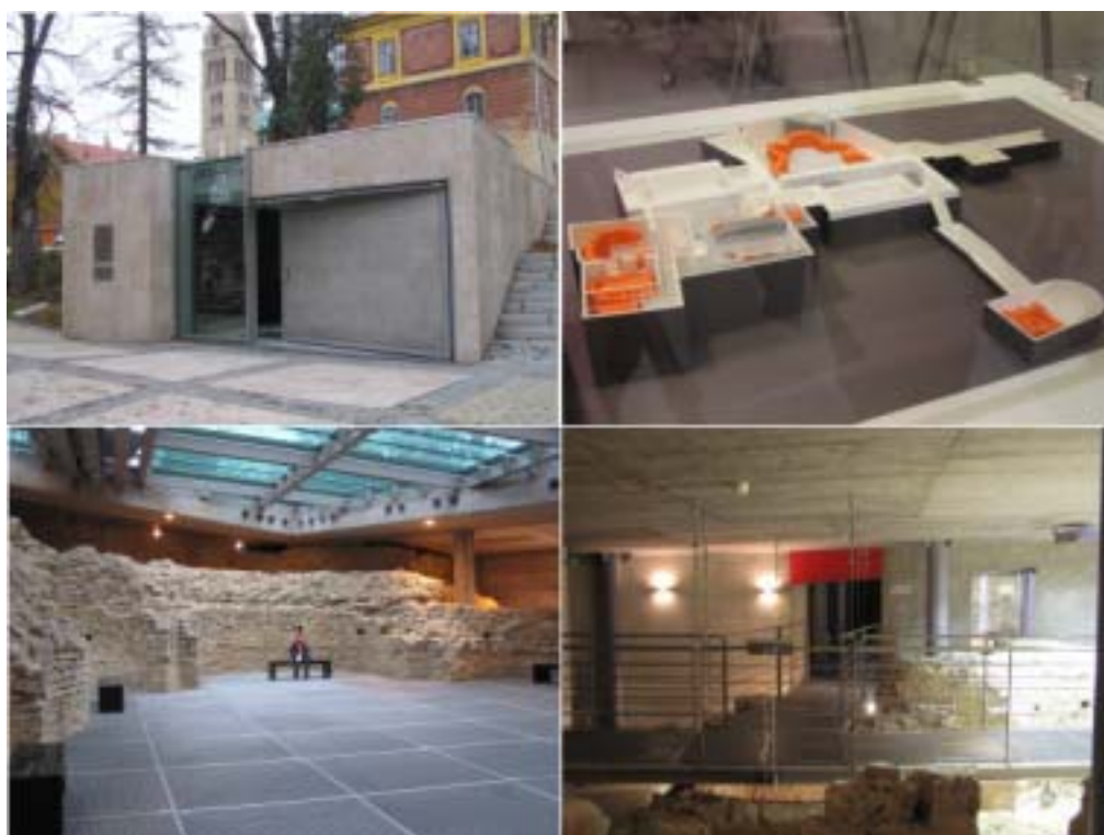
左上から時計回りに、ビジターセンター入口、ツェラ・セプティコラ模型、ツェラ・セプティコラ内部