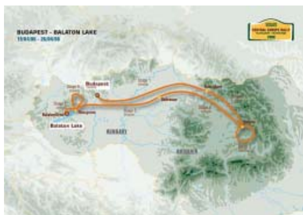
中欧ラリーのコースイメージ(中欧ラリーHPより転載)