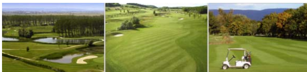
左から順に Birdland、Panninia、Old Lake ゴルフ場

(出典: Business Traveller Hungary June 2008)