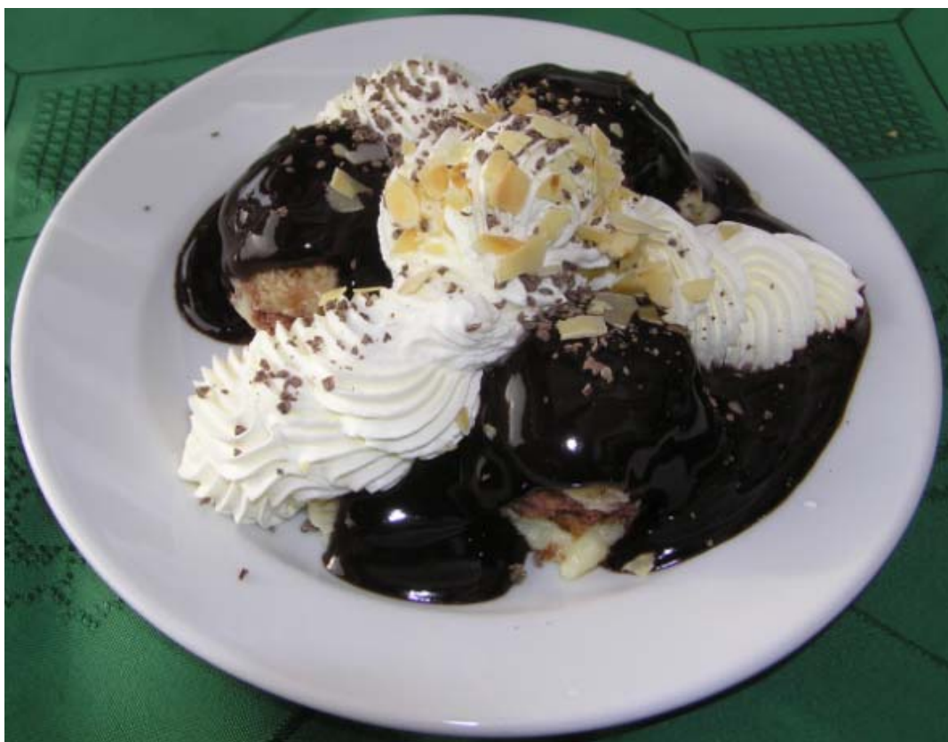
ハンガリアン・スイーツの定番、ショムローイ・ガルシュカ(Somloi Galuska) ボール状にカットしたスポンジケーキにチョコレートソースとホイップクリームをかけた上品なデザート