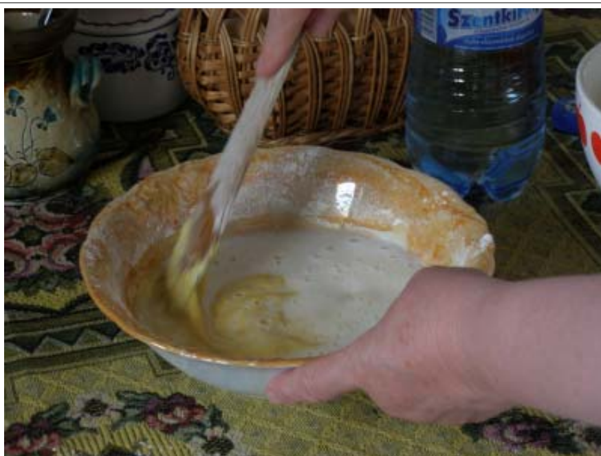
分量の材料をかき混ぜた後に炭酸水を加えるのがコツ