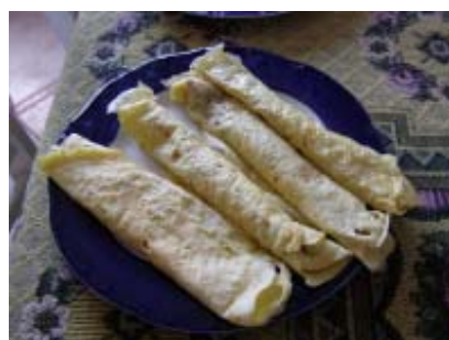
アンズやイチゴなどのジャムを巻いて完成

ハンガリアン・スイーツの定番、パラチンタ(palacsinta)ハンガリー風クレープ