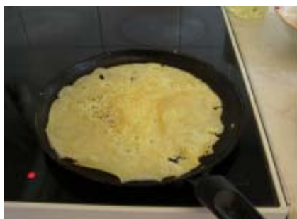
専用のフライパンで焼く