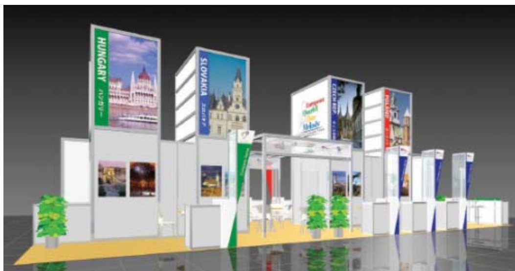
V4 ヴィシェグラード・グループ4ヶ国ブース・イメージ

JATA世界旅行博2008についての詳細は http://ryokohaku.com/ をご覧下さい。