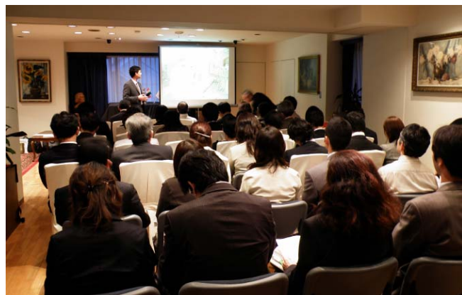
クロスロハン 3 カ国合同セミナーの風景

この新 3 カ国周遊ツアーコースは、アドリア海の真珠「ドブロヴニク」、アルプスの真珠「ブレッド湖」、ドナウの真珠「ブダペスト」ととえられる 3 カ国を巡ることから、パールロード(真珠の道)と命名しました。