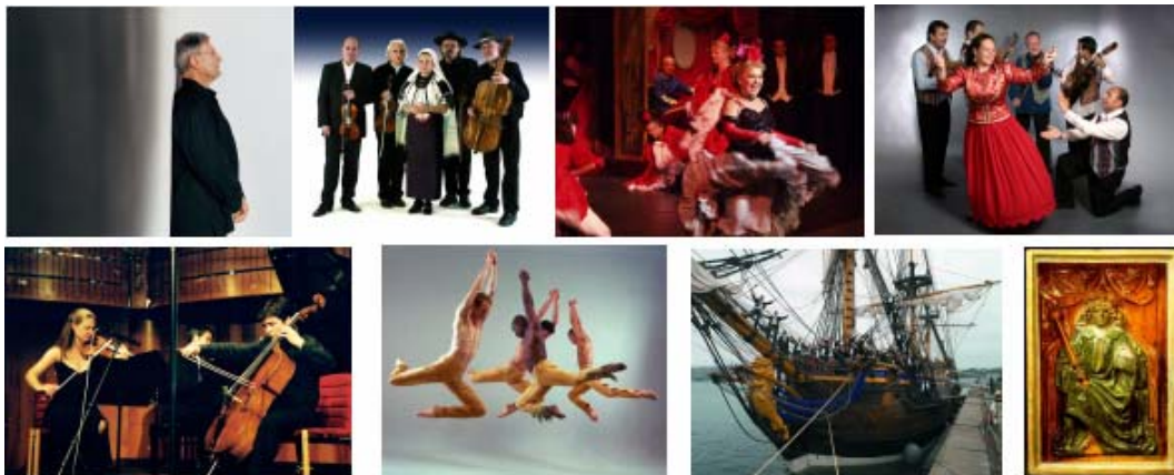
2008 年のブダペスト春の祭典イメージ