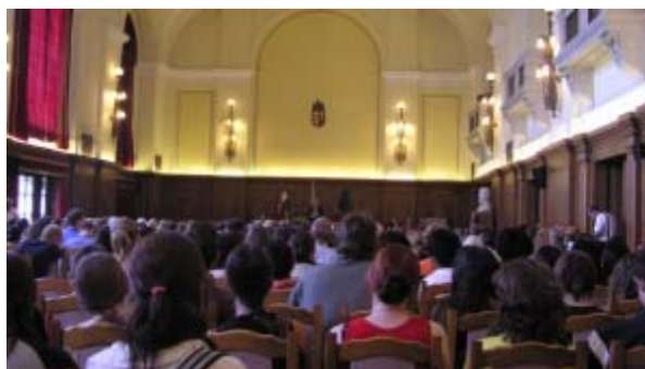
デブレツェン大学の夏のハンガリー語講座開講式

講座の申し込み期限は 2009 年 6 月 15 日で、詳細は www.summerschool.hu (英語)または次の E メールで問い合わせ debrecen@nyariegyetem.hu (英語)。