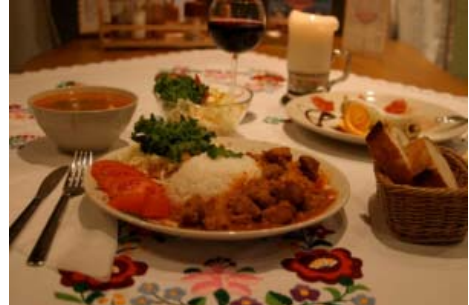
牛や豚肉のシチュー「ブルクルト」